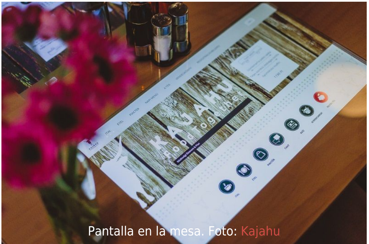
Pantalla en la mesa.