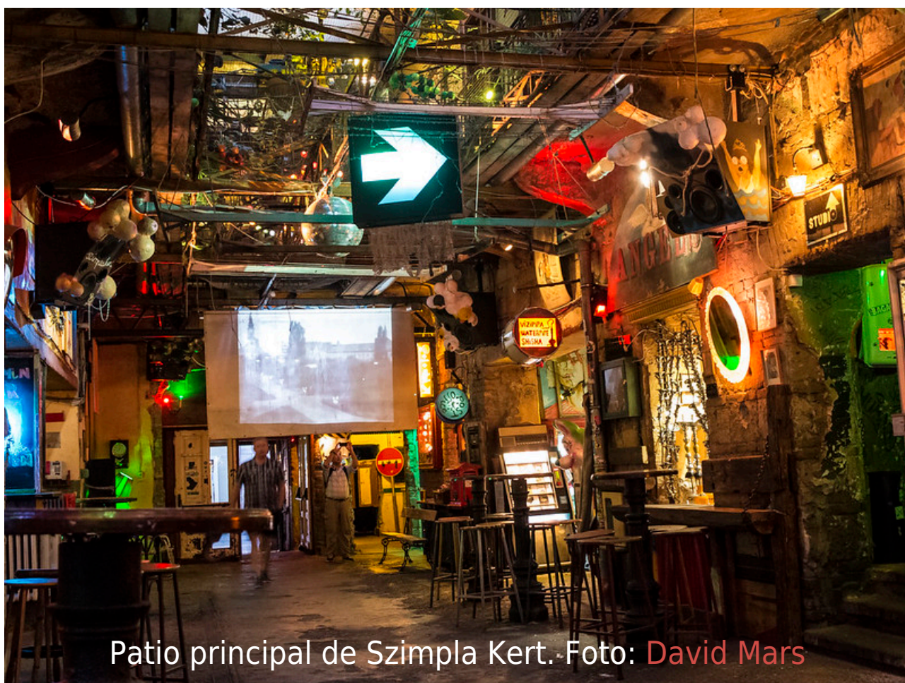
Patio principal de Szimpla Kert.

Lee más sobre Szimpla Kert en Szimpla Kert , el pub en ruinas más famoso de Budapest