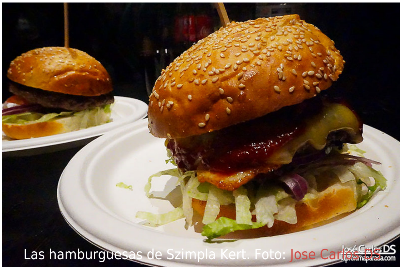
Las hamburguesas de Szimpla Kert.